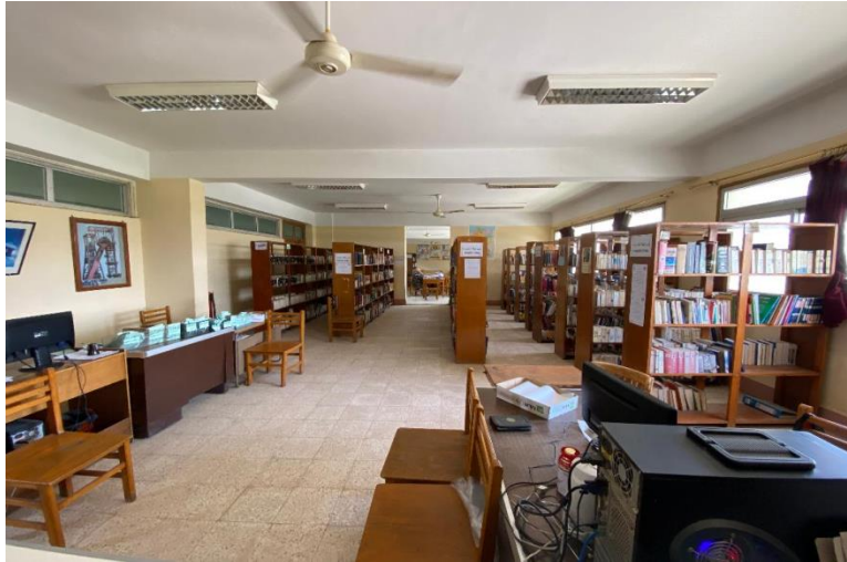
مكتبة كلية الألسن

- يصل المكتبة دعم مادي كل عام يتم توزيعه على البرامج لشراء احتياجاتها من الكتب أو القواميس أو المراجع ويقوم العاملون بالمكتبة بعمل الإجراءات الإدارية الخاصة بفحص الكتب وتسجيلها بدفاتر المكتبة. جدير بالذكر أن بعض العاملين بإدارة المكتبة قد حضر بعض ورش العمل الخاصة بالمكتبات وخصوصاً "تنمية مهارات العاملين بالمكتبات الجامعية" وذلك من أجل الارتقاء بنوعية الخدمات التي تقدمها مكتبة الكلية لروادها. وقد تم فحص المكتبة باستخدام نموذج التقييم الكمي الصادر من الهيئة القومية لضمان الجودة والاعتماد.