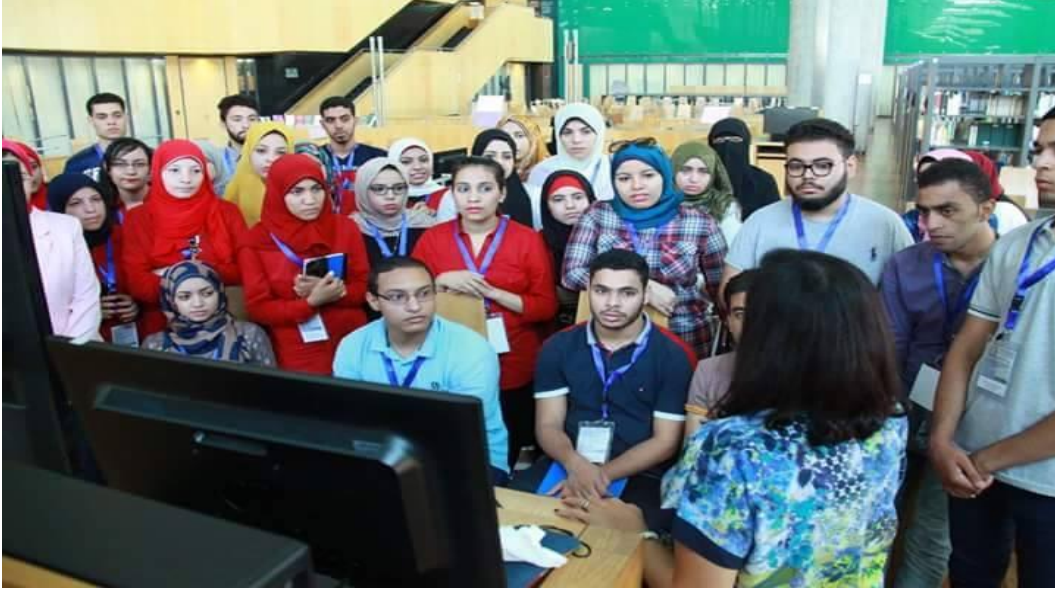
مشاركة طلاب البرنامج لتدريب الطلاب في الأنشطة الفرانكوفونية بمكتبة الإسكندرية